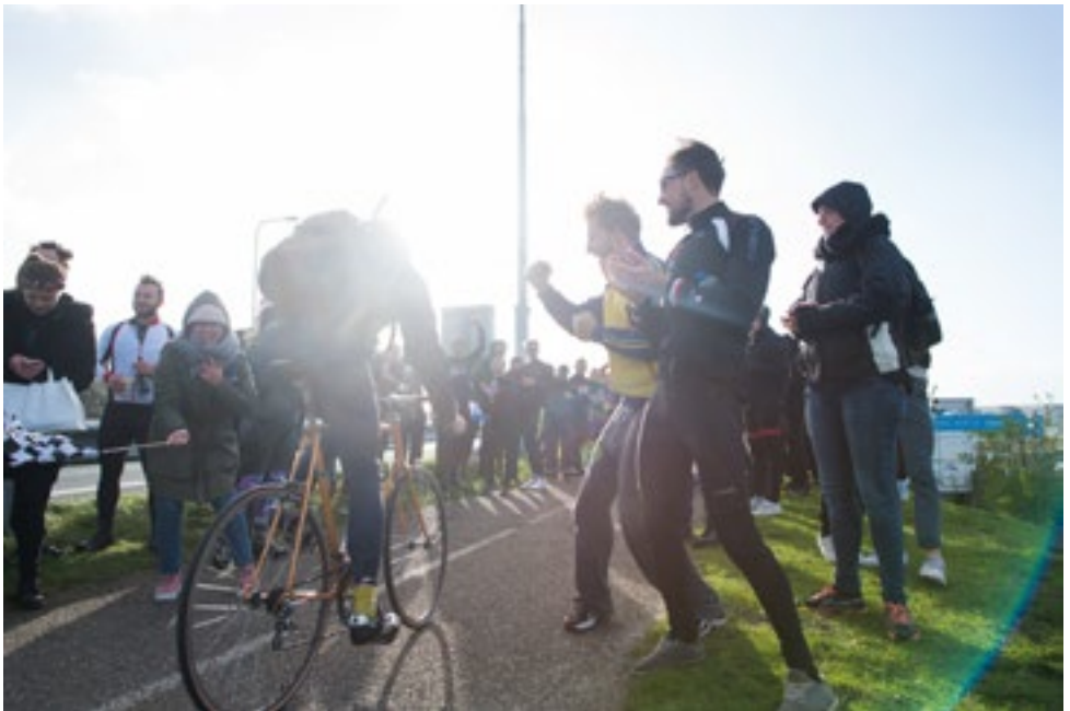
De finish van de Afsluitrace