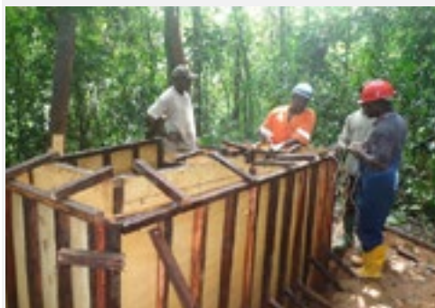
Werk aan de storagetank in Lobange

Lobange heeft flinke stappen gemaakt in 2017. De storage tank, zand-filtertank en buitenkranen zijn geplaatst, met een enorme betrokkenheid van de gemeenschap. Ook zijn het bestuur en onderhoudsmedewerkers getraind in het managen van het systeem. De gemeenschap is erg gemotiveerd, mede ook door de aanwezigheid van youth council in het dorp, en de samenwerking met onze lokale projectpartner Jaba wordt steeds hechter.