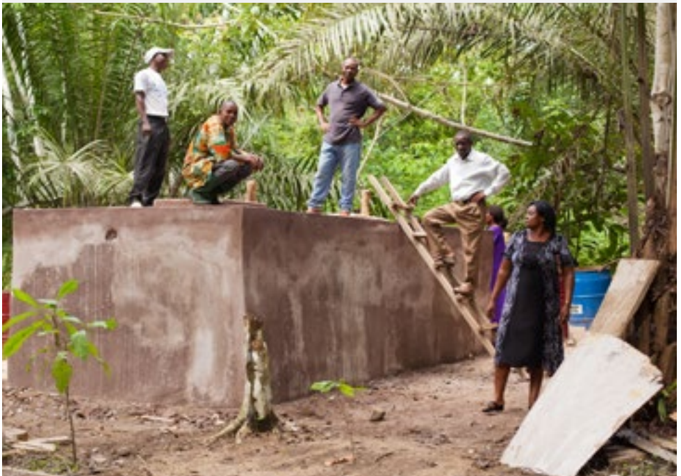
De storagetank van Manganjo