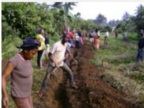
Aan het werk in Diffa