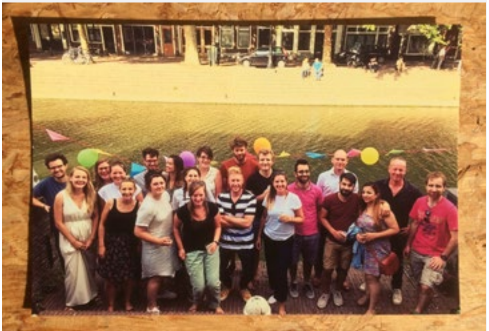
Vrijwilligersborrel voor ons kantoor aan de Bemurde Weerd