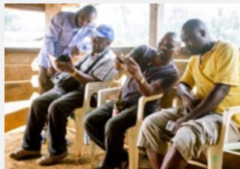
Eyole en Jaba met twee mannen uit Lobange