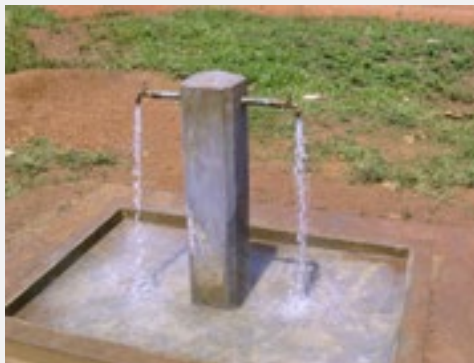
Stromend water in Diffa