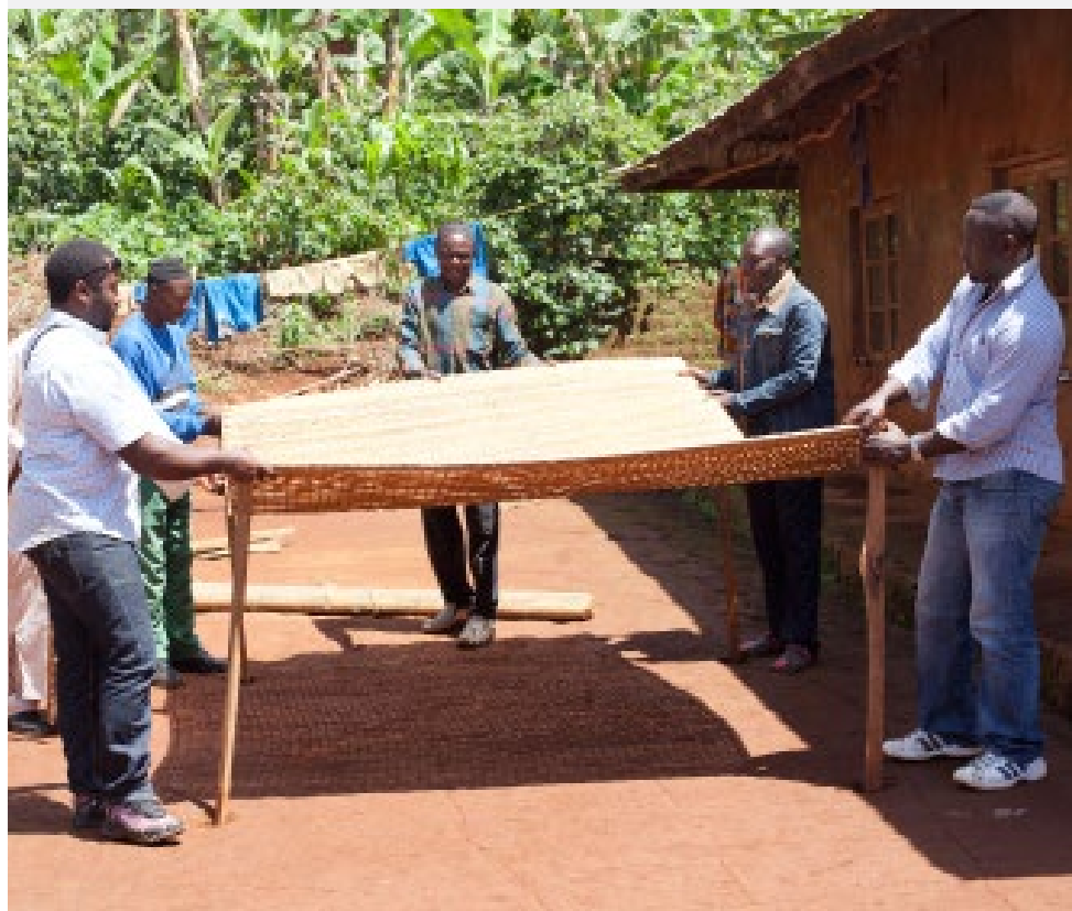
Koffieboeren drogen hun oogst