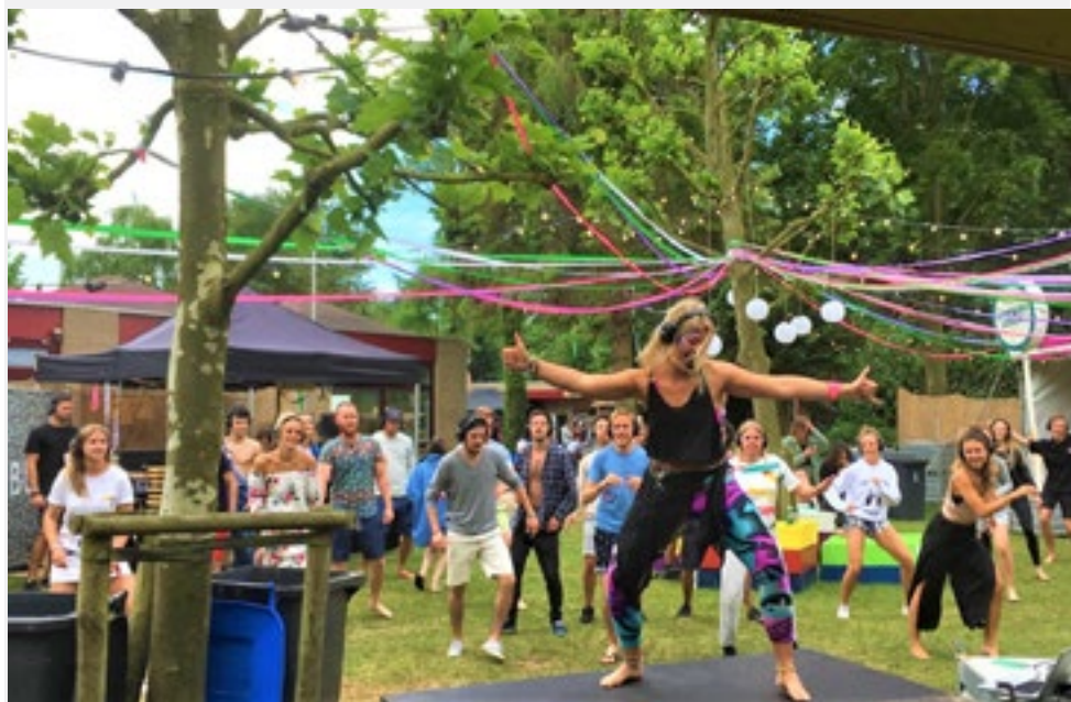
Ochtendgymnastiek op de camping van Amsterdam Open Air