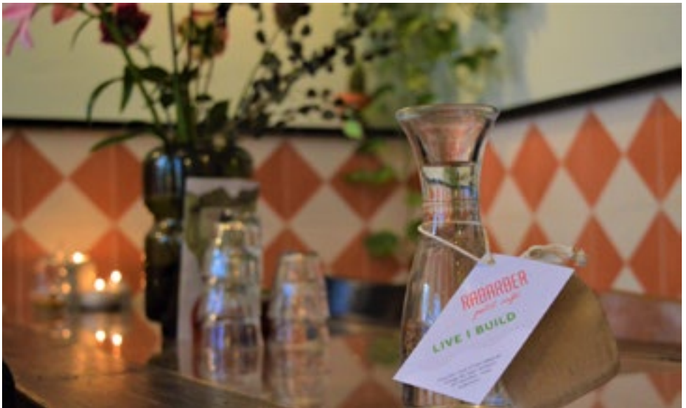
De Karaffenactie in petit café Rabarber